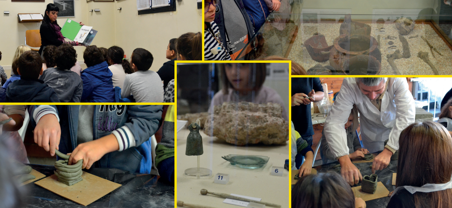
Immagini dell'Open Day 2017 Museo Civico (22.10.2017)